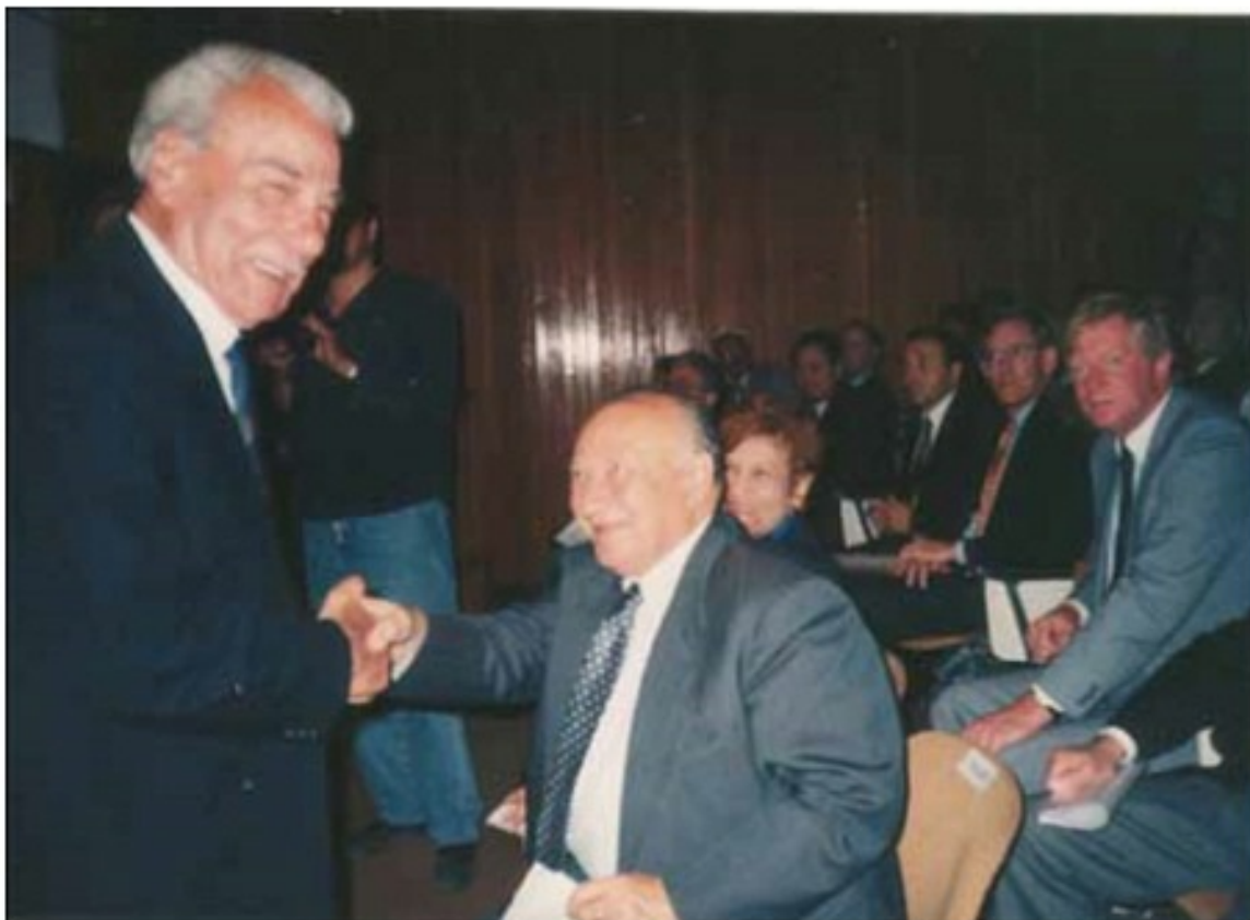
Ένα ακόμη στιγμιότυπο από την εκδήλωση της Ρωσικής Πρεσβείας στη Λευκωσία το 1995. Συγχαρητήρια από τον κ. Κληρίδη, Πρόεδρο της Δημοκρατίας.

τ/αγ. 4. Αγαμέμνων Γουλιμίδης. Base Depot RASC. 17.E.F. '61 12/6/41. Ηγαυδιλή μου Καλλιόπη, πόσα λες δέω είμαι ένθετος ναγα εδω λίγους ύστερα από τους δε ριδικούς έγδαα εις τον απο ορισμό μου. Την 2/6/41 εως αχα ελίζη εισολογήτη διεξέρω όμως αν την ελπίεις. Δεν αγορά τον ποτόνιου η περιπέτεια σου έκα σπαρτα ενολοαίς διε ηφωρτώ τα εαυ ελμυρική, είντοι όλαν άνταφωδει μεν. Απώ την 28/6/41 μέχρι της 12/6/41 είχοντα εως ένα σπουγγι σου ωστα εδω ηγ έμει ηγ γράσει να βρη την ζυγιά του ηγ έβη την βρυσου. ηγ εις το λίγος εαυ βρυσου την ζυγιά του, γαρτά σου την καρία του.