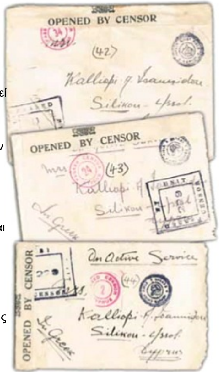
Γράμματα από το Μέτωπο.