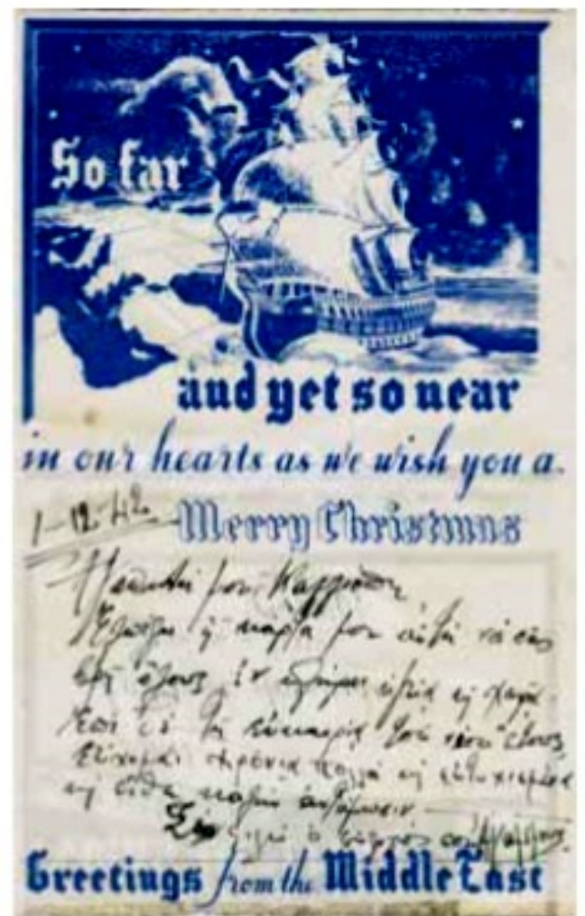
Χριστουγεννιάτικη κάρτα, 1942.