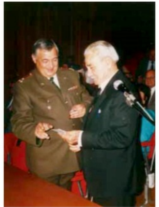
Στην εκδήλωση της Ρωσικής Πρεσβείας στη Λευκωσία, 1995.

σκοπισμένους δρόμους των χωριών. Καθώς οι Γερμανοί προχωρούσαν προς την Καλαμάτα, η μικρή ομάδα του Αγαμέμνονα είχε κυκλωθεί και δύσκολα θα απέφευγαν την αιχμαλωσία. Οι αξιωματικοί τους τούς είπαν, με τον ασύρματο, ότι δεν θα προλάβαιναν να φτάσουν στην Καλαμάτα. Τούς διέταξαν να βγάλουν τα στρατιωτικά τους, να φορέσουν πολιτικά για να μπορούν να κρύβονται και ο καθένας να προσπαθούσε να σωθεί μόνος του, ή σε μικρές ομάδες. Πάντα, αν τα κατάφερναν ν' αποφύγουν την αιχμαλωσία, ο προορισμός τους ήταν η Αίγυπτος